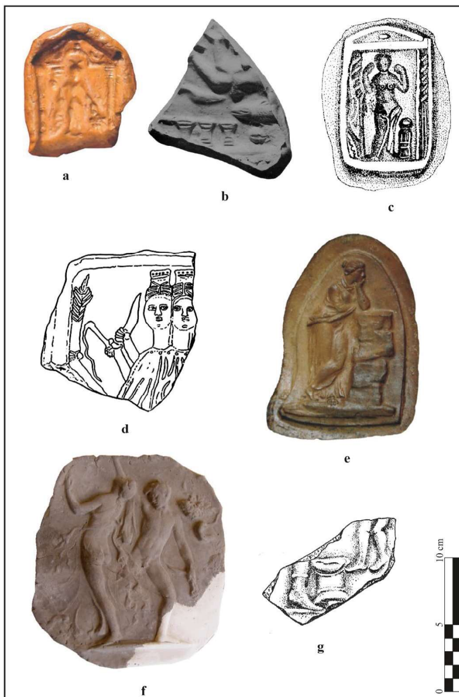
Fig. 2 – a) Tipar plăcuță, Liber ( apud Man 2010); b) Tipar plăcuță, Cavalerii Danubieni ( apud Tudor 1960); c) Tipar plăcuță, Venus ( apud Cociș 1987); d) Tipar plăcuță, Hekate ( apud Tudor 1941); e) Tipar plăcuță, Polymnia ( apud Coroplastica 2011); f) Plăcuță, Satyrus/Menadă ( apud Coroplastica 2011); g) Plăcuță, scenă religioasă ( apud Bondoc, Dincă 2005).