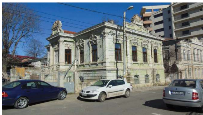
Fig. 11 Casa ce i-a aparținut profesorului Constantin Motomanca, situată în Tulcea.