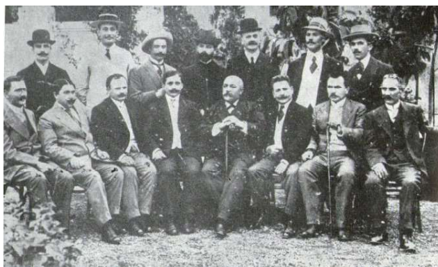
Fig. 13 Corpul profesoral al Liceului „ Principele Carol ” din Tulcea în primii ani ai secolului al XX-lea.