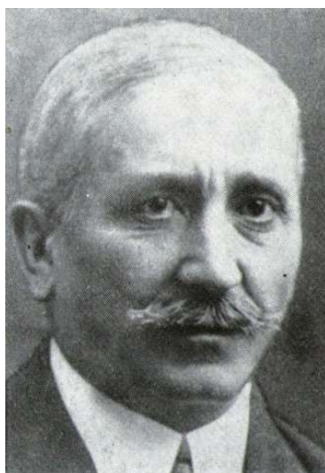
Fig. 10 Profesorului Constantin Motomanca în preajma anului 1935.