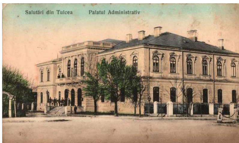
Fig. 15 Prefectura județului Tulcea.